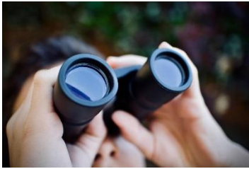
Abbildung 3 telescope-5257599_by_sweetlouise_pixabay_pfarbrieftservice

Der Blick von außen kann wertvoll sein und ist für eine professionelle Schulentwicklung unerlässlich. Unsere Mitgliedsschulen können die Externe Evaluation des Katholischen Schulwerks in Bayern anfordern. Damit dieses wertvolle Instrument weiter mit aktuellen Anforderungen Schritt hält, wurden die Online-Fragebögen – eines von mehreren Werkzeugen zur Datengewinnung im Rahmen einer Externen Evaluation - in Kooperation mit dem Kompetenzzentrum für Schulentwicklung und Evaluation der Friedrich-Alexander-Universität Erlangen Nürnberg inhaltlich