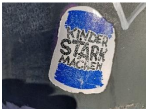
Abbildung 1

Die nachhaltige Zusammenarbeit von Elternhaus und Schule ist wichtiger Bestandteil der täglichen Arbeit an den Mitgliedsschulen des Katholischen Schulwerks in Bayern und trägt zur Schärfung des Profils bei. Auch im diesem Schuljahr unterstützen wir Sie mit Angeboten und Anregungen für Lehrkräfte und Eltern und bieten die Möglichkeit der Zertifizierung. Informieren Sie sich auf unserer Homepage ( www.schulwerk-bayern.de ) oder klicken Sie direkt auf die Übersichten: